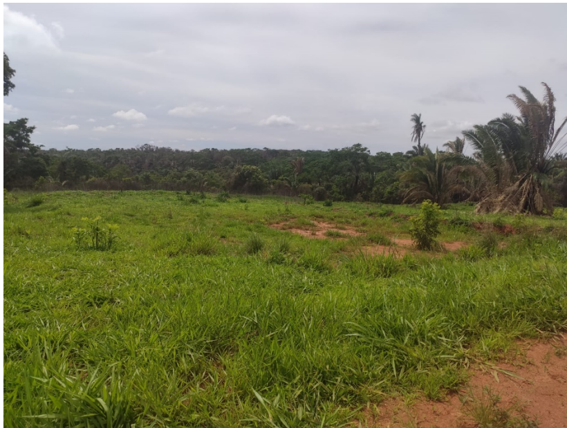
Futura instalação do Centro Comunitário da mata