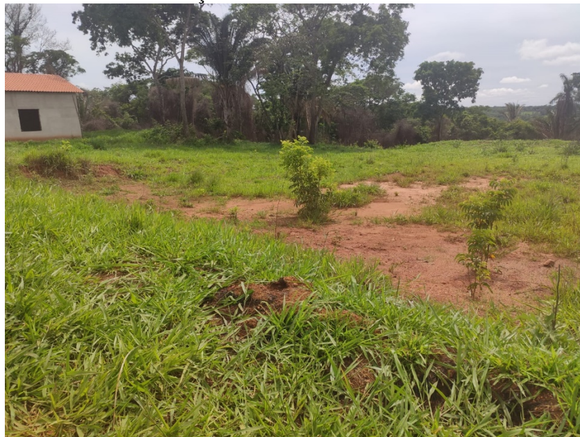
Futura instalação do Centro Comunitário da mata